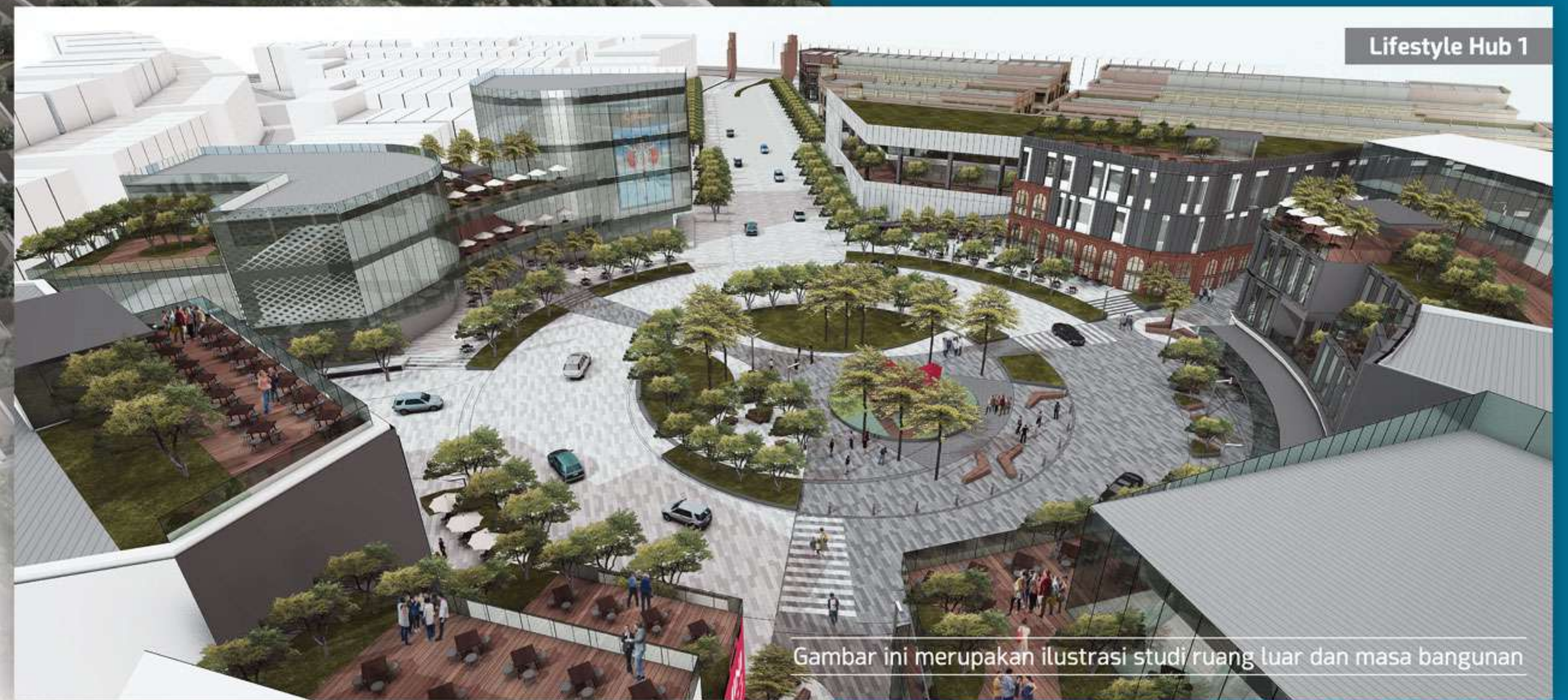
Gambar ini merupakan ilustrasi studi masa bangunan